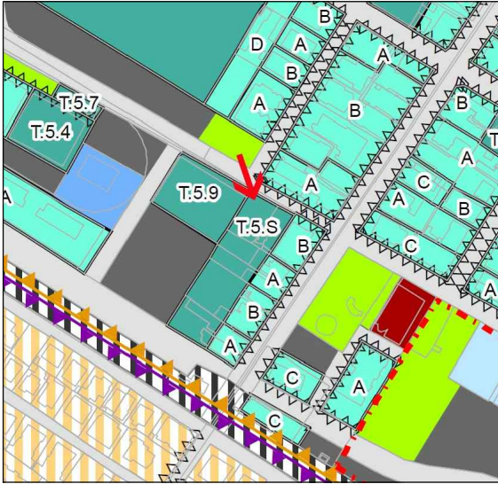
Tav3b-1_NORD_Disciplina degli interventi diretti base catasto