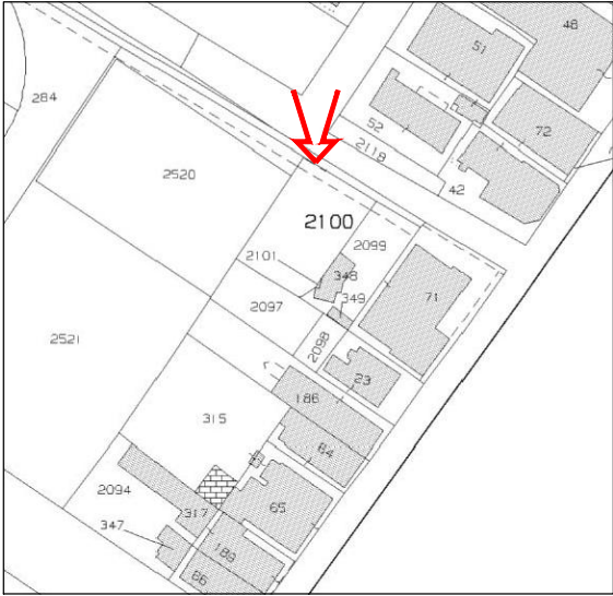
ESTRATTO DI MAPPA FOGLIO N.3 MAPPALE N.2100