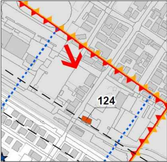
Tav1c1_Vincoli ambientali e storico culturali e rispetti delle infrastrutture