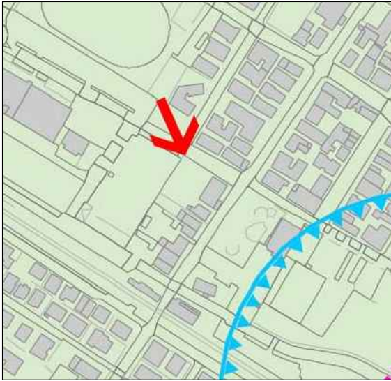
Tav1c2_Vincoli vulnerabilità idrauliche e idrogeologiche